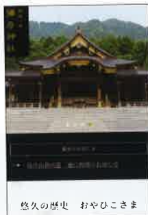
悠久の歴史 おやひこさま